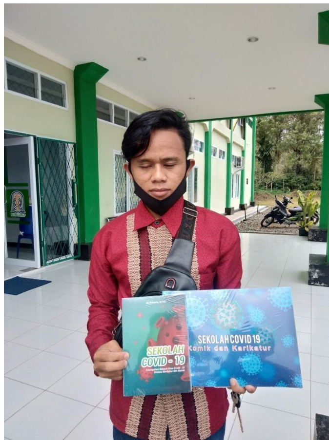
“Mahasiswa IAIN Curup ikut berdonasi untuk membantu korban covid - 19”