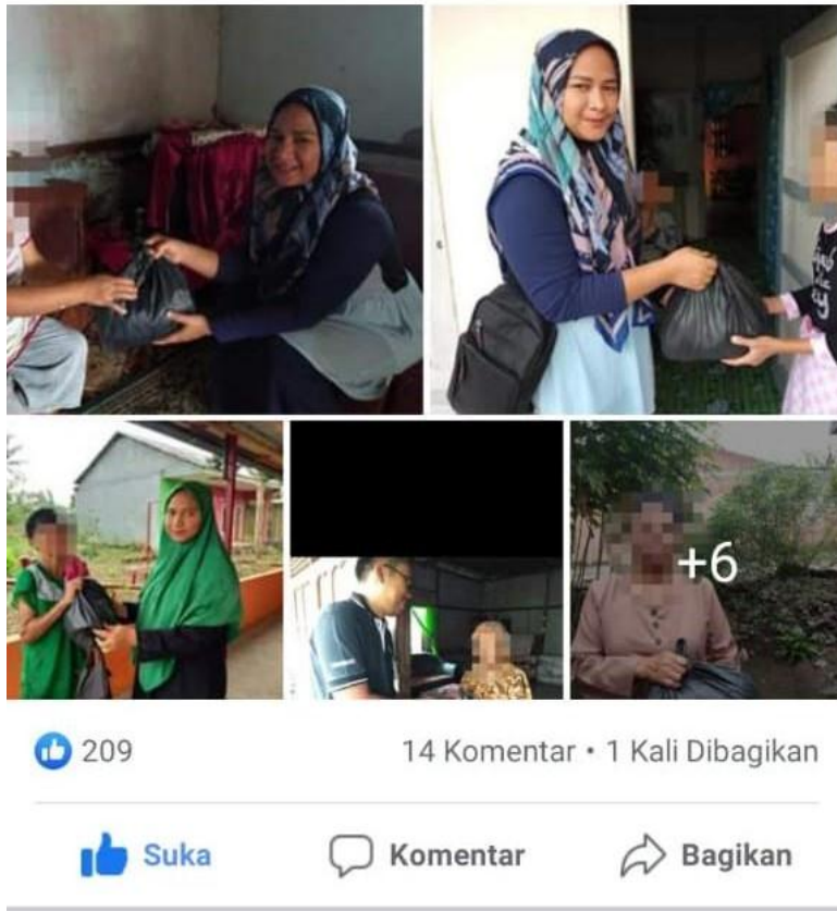
“Penyerahan Donasi Buku bagi masyarakat terdampak corona”