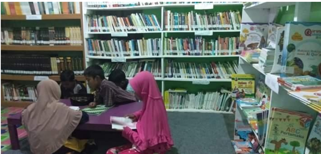
“Kegiatan di Taman Belajar Masyarakat Masa New Normal”